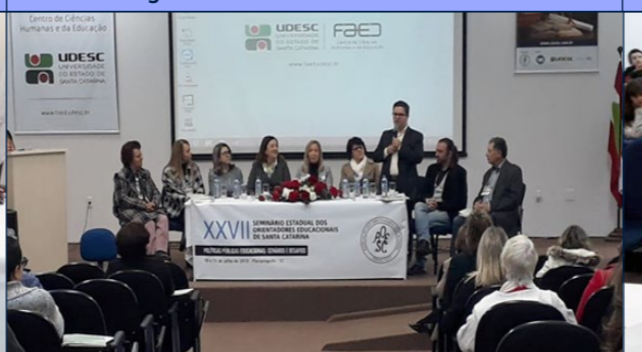
XXVII Seminário Estadual dos Orientadores Educacionais Mesa de abertura -10 e 11 de Julho de 2019