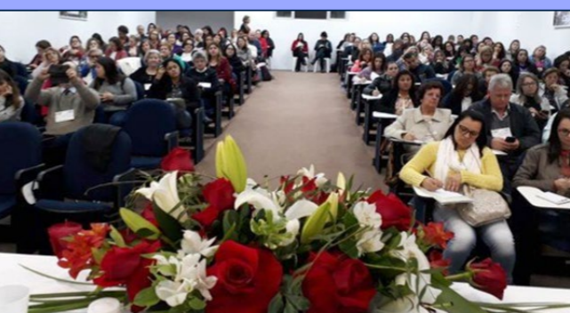
XXVII Seminário Estadual dos Orientadores Educacionais Auditório Lotado -10 e 11 de Julho de 2019