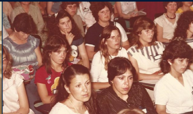
II Encontro Regional de Orientadores Educacionais – Sul Florianópolis, 12 a 16 de novembro de 1983