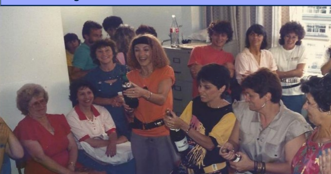
Após 16 anos a AOESC merece sua casa própria! Inauguração da Sede da AOESC -1986