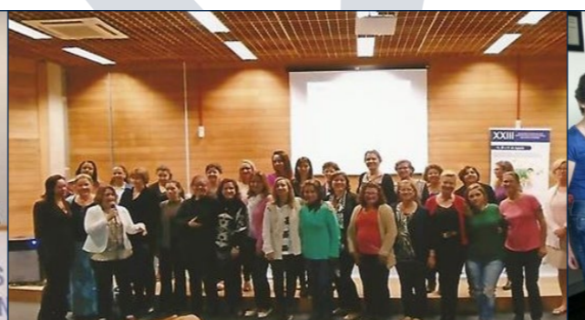
XXIII Seminário Estadual dos Orientadores Educacionais - 19 a 21 de Agosto de 2015