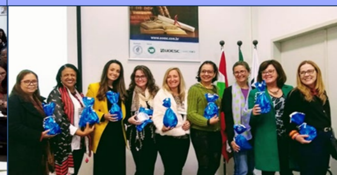
XXIV Seminário Estadual dos Orientadores Educacionais de Santa Catarina - Setembro de 2016