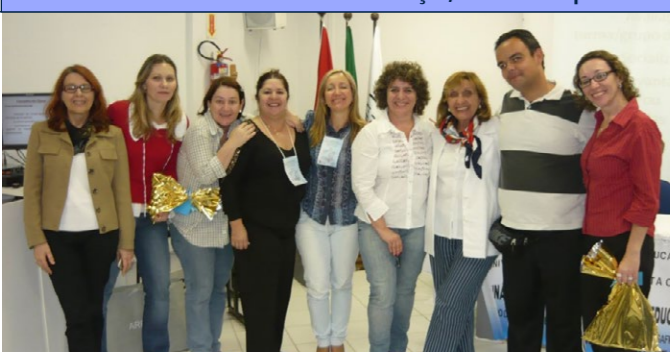
XX Seminário Estadual dos Orientadores Educacionais - 29 a 31 de Agosto de 2012