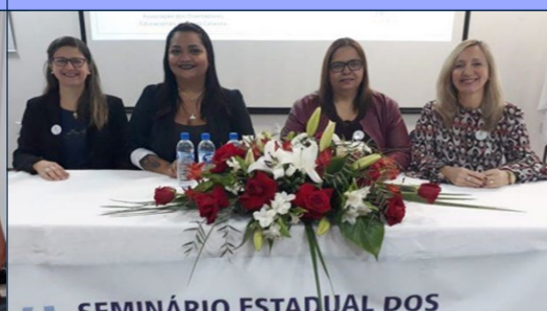
XXVI Seminário Estadual dos Orientadores Educacionais - Diretoria - 12 e 13 de Setembro de 2018