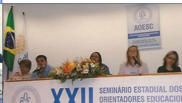
XXII Seminário Estadual dos Orientadores Educacionais - 24 a 26 de Setembro de 2014