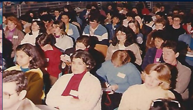
I Seminário da AOESC Florianópolis, 28 a 31 de agosto de 1985