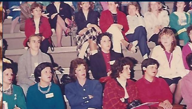
I Seminário da AOESC Florianópolis, 28 a 31 de agosto de 1985