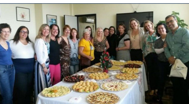
Coquetel em Comemoração ao "Dia do Orientador Educacional" - 7 de Dezembro de 2016