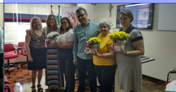
Homenagem às ex-presidentes da AOESC - 7 de Dezembro de 2016