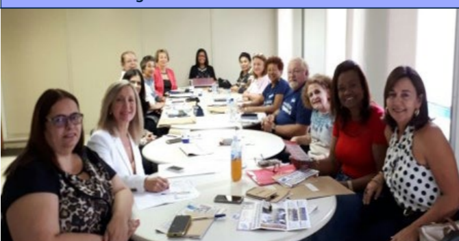
XXI FESED - Brasília - de 20 a 22 de Maio de 2017