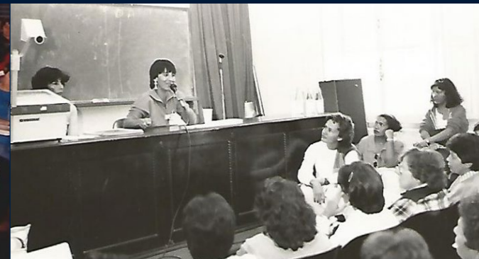
II Seminário Estadual dos Orientadores Educacionais - Florianópolis, 3 a 5 de Dezembro de 1986