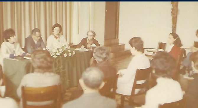
Fundação da AOESC, em 29 de agosto de 1970,